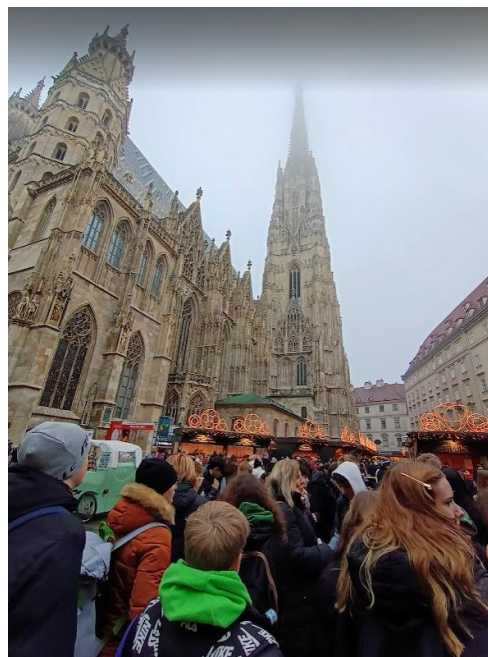
U katedrály Sv. Štěpána

procházka centrem města a další nálož informací z úst paní průvodkyně. Kvůli mlze jsme sice neměli pořádný výhled, nicméně viděli jsme toho hodně: výstavní domy na pěších zónách, malé uličky, obchůdky a hlavně úžasná katedrála Svatého Štěpána. Náš program jsme zakončili návštěvou proslulých vánočních trhů na náměstí u staré radnice. Jsou opravdu krásné a jako celá Vídeň stojí za návštěvu.