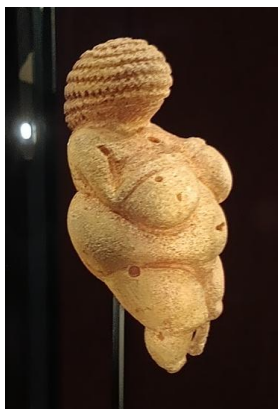
Venuše z Willendorfu

Dne 18.12. se někteří žáci 7., 8. a 9. ročníku zúčastnili poznávacího zájezdu do Vídně.