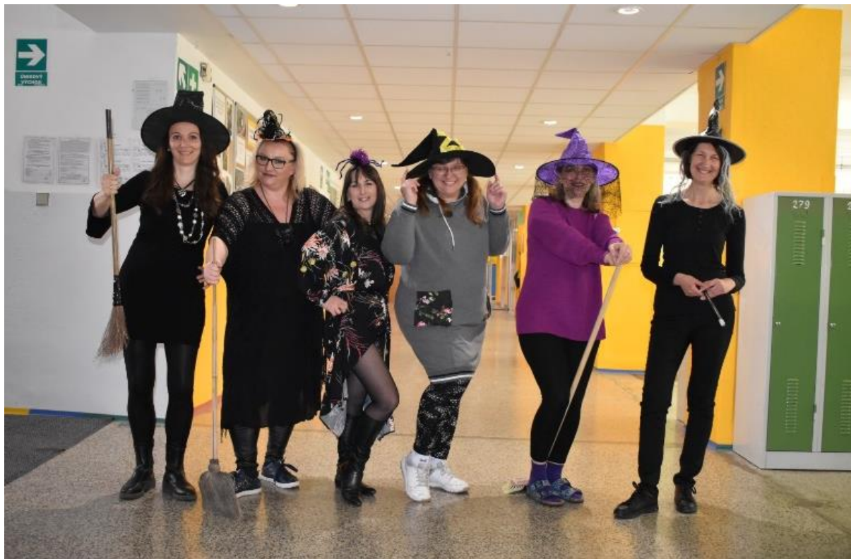
Vychovatelky školní družiny 30. dubna 2023:

Škola poskytuje podnájem agenturám, které nabízí různé zájmové kroužky. Školní družina úzce spolupracuje s organizací odchodu žáků na kroužek a převzetí žáků zpět do školní družiny. Plně zabezpečuje plynulý přechod žáka a eviduje jeho momentální nepřítomnost ve školní družině. Po skončení zájmového kroužku žáka převezme paní vychovatelka do příslušného oddělení a zajistí tak potřebnou bezpečnost jeho pobytu ve škole.