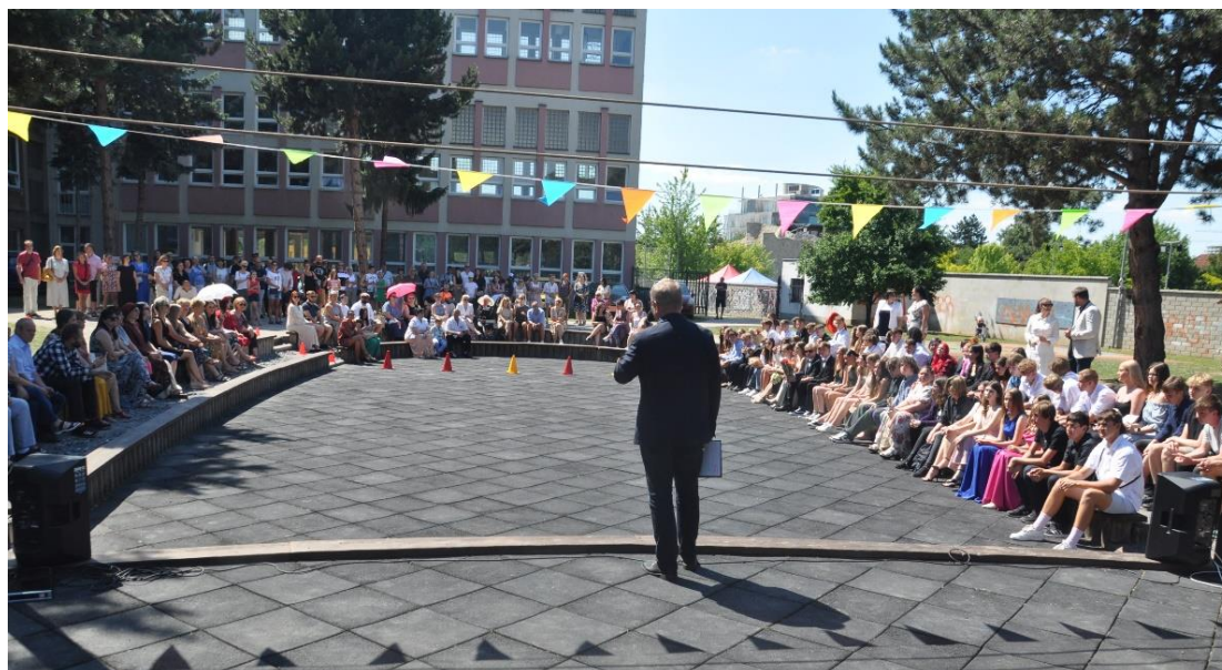
29. 6. 2023/ Rozloučení s rodiči a žáky 9. ročníku