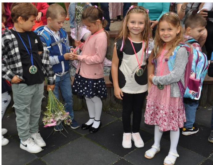
Je 1. září 2022 – noví žáčci 1. ročníku