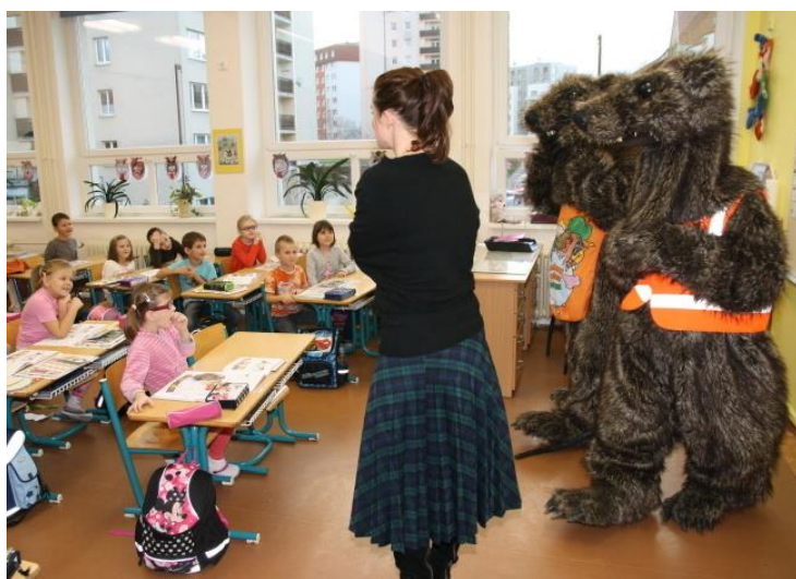
Environmentální výchova - to velké chlupaté jsou potkani (přatelští)