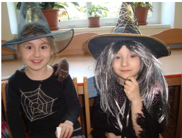
Na shledanou ve školním roce 2016/2017

Uvedené části výroční zprávy byly zkompletovány 14. 9. 2016 Výroční zpráva byla projednána a schválena dne 5. 10. 2016 školskou radou.