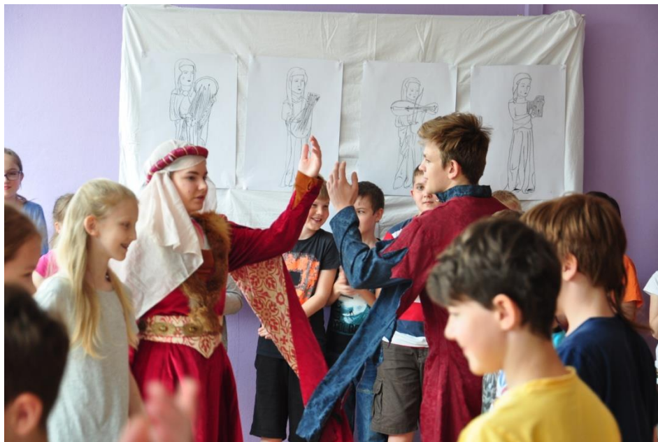
DEN KARLA IV. Žáci školy při nácviu dobového tance