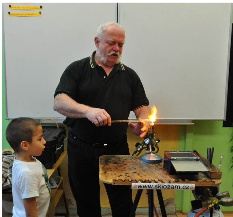
Hluboký nádech - s pomocí skláře si žáci vyfouknou vlastní skleněný výrobek