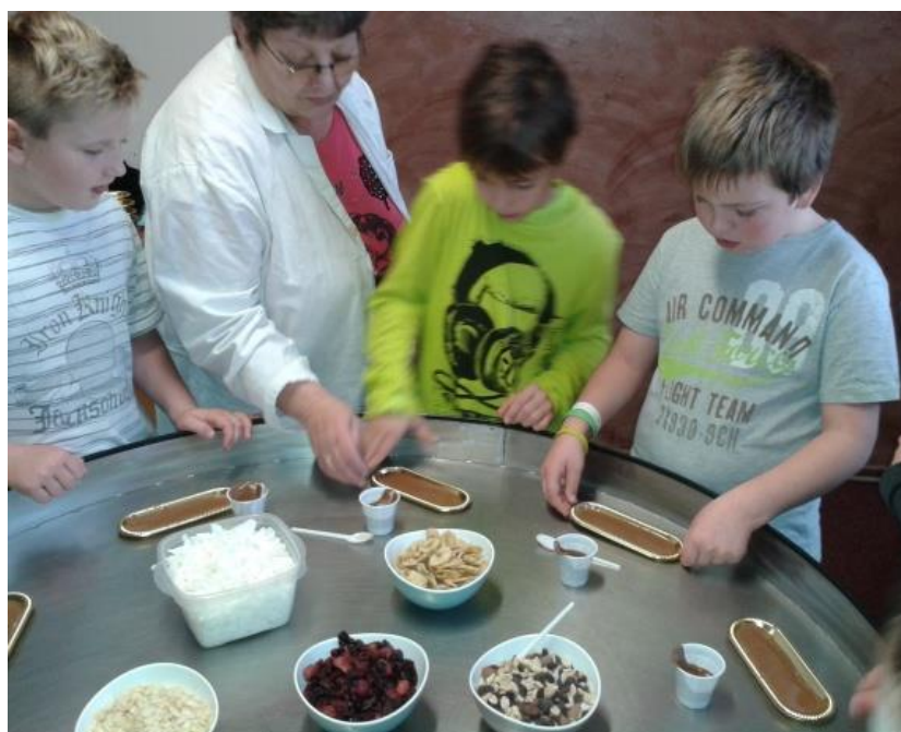
V čokoládovně si každý žák vyzdobil vlastní dobrotu