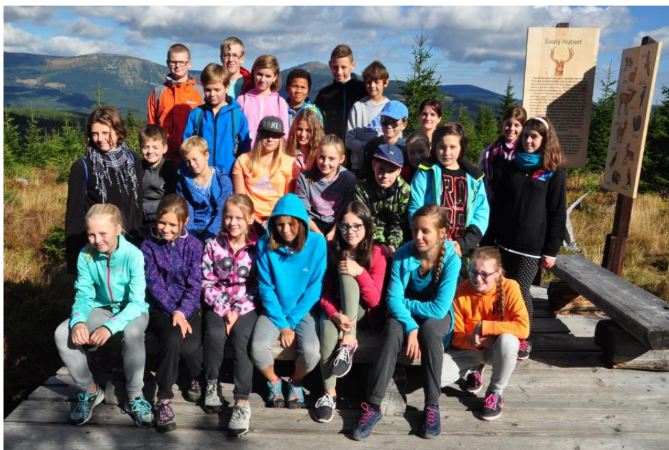
Adaptační kurz 6. tříd, uprostřed Sněžka 1602 m/n/m.