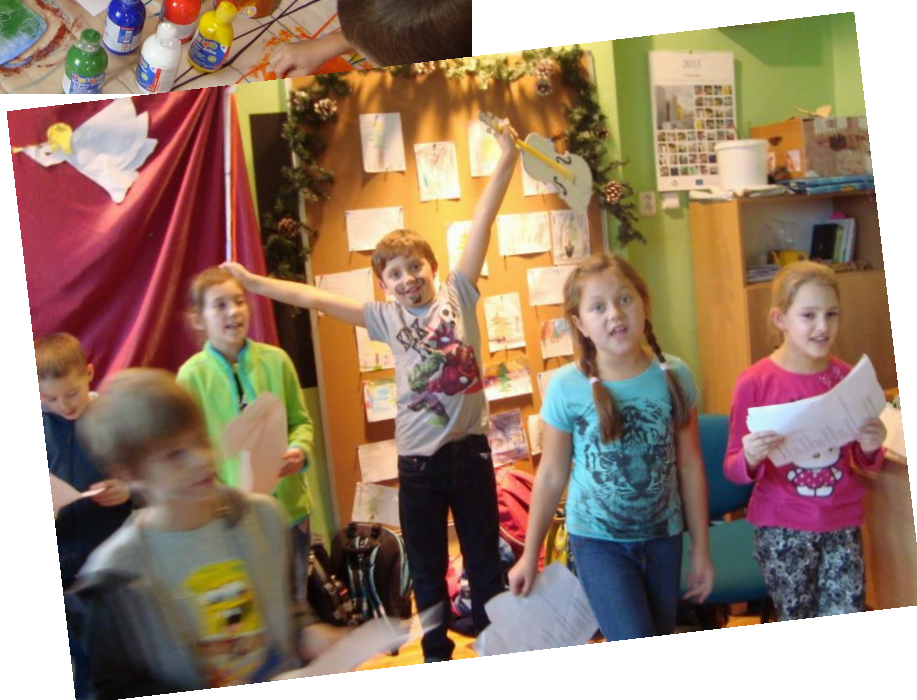
Návštěva tiskařské dílny v domě UM // Vánoce ve školní družině