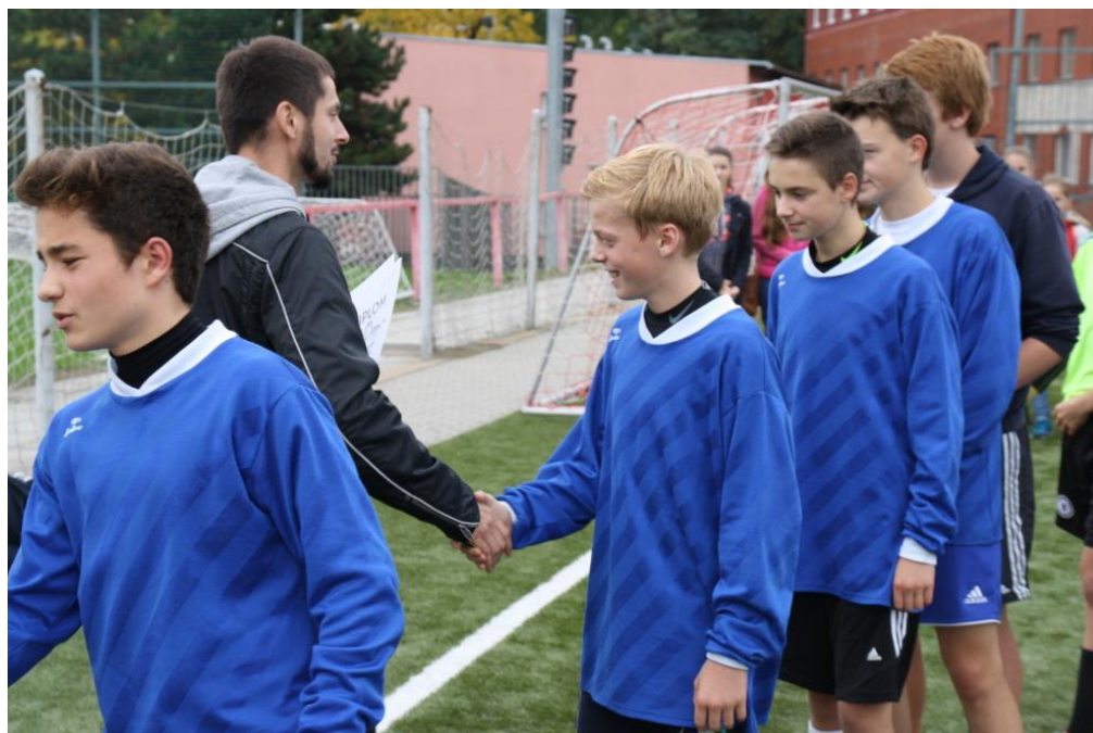
KOPANÁ - Turnaj o pohár starosty, výběr žáků 8. a 9. tříd.