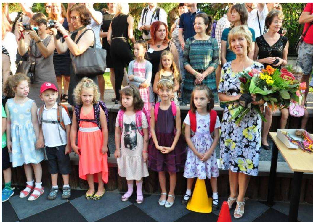
Slavnostní zahájení školního roku 2015/2016 probíhá tradičně ve školním amfiteátru