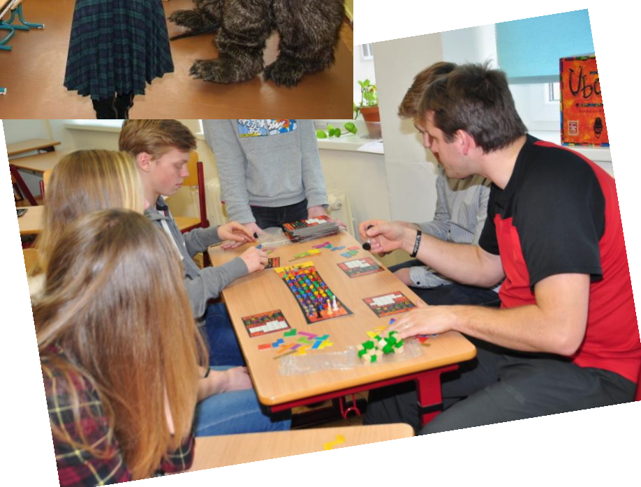
Herní odpoledne deskových her Gutovské rady