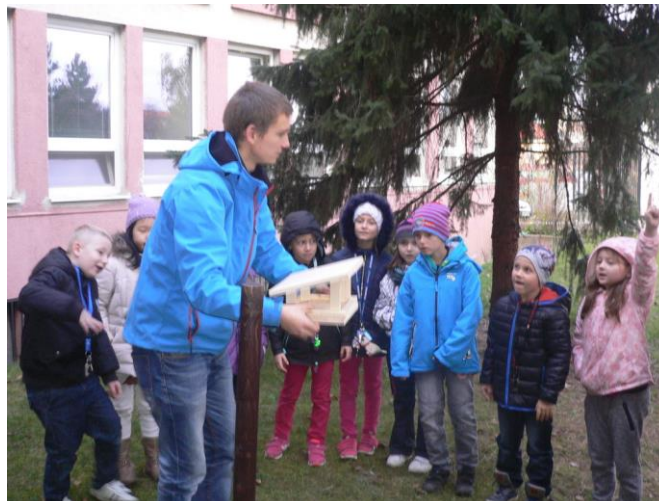
Na školní zahradě - program Krmítka do škol. Máme tři.