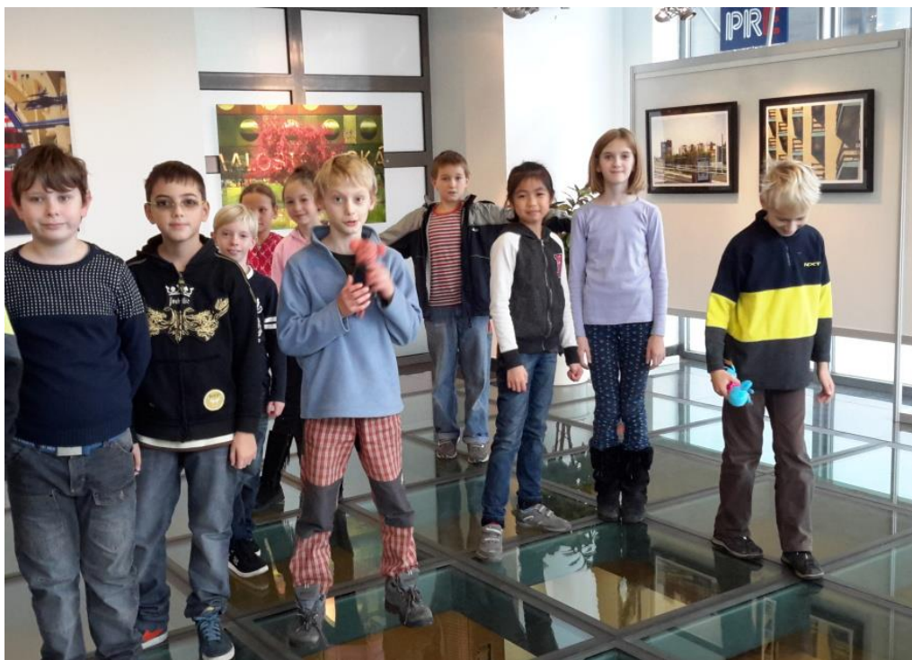
V Galerii PRE. Zajímá více moderní umění nebo skleněná podlaha ?