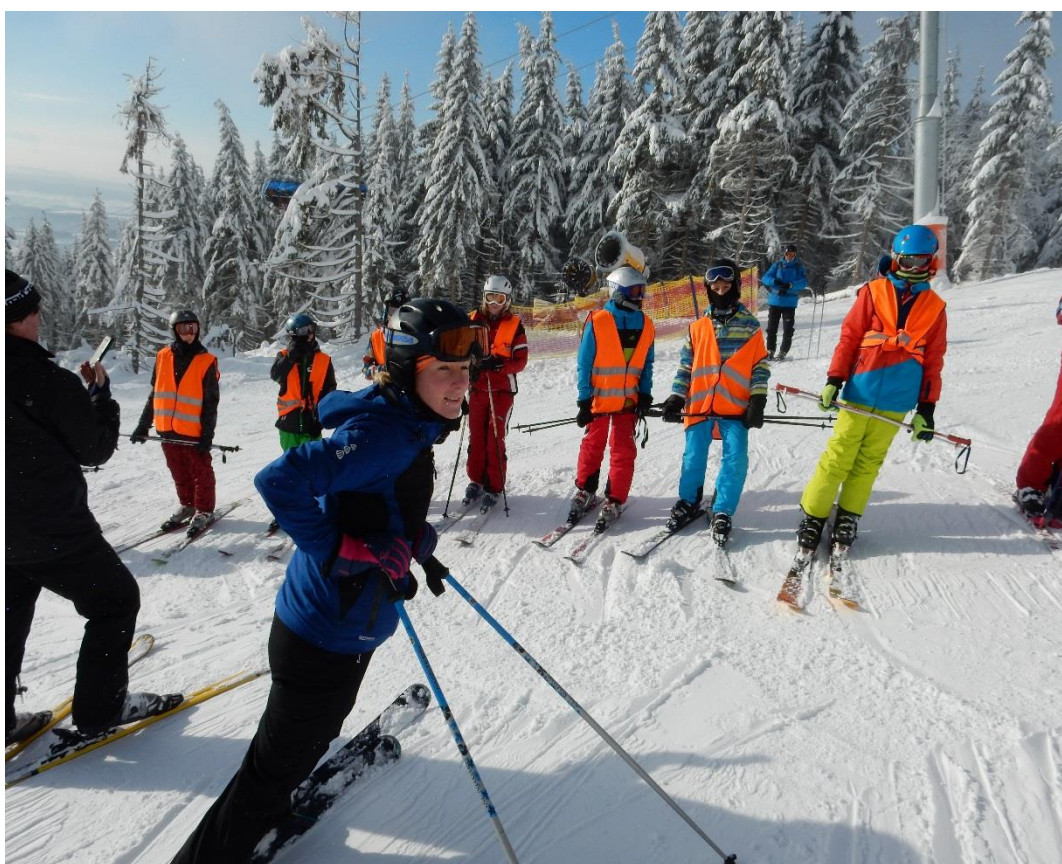
Lyžařský výcvikový kurz na Černé hoře