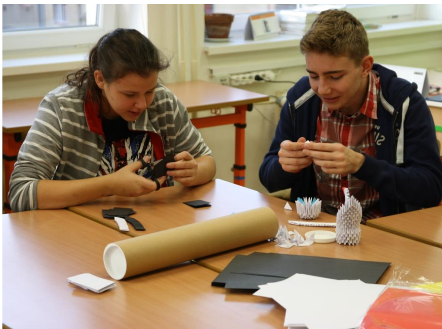
Na výrobě dárků pro jarmark se podílejí žáci všech ročníků

Součinnost s rodiči je trvale velmi široká a vedle hlavní činnosti školy patří k nejvíce zastoupeným činnostem. Vzhledem k velikosti školy (630 žáků/ cca 1250 rodičů) nelze až na výjimky požádat hromadné akce. Setkání probíhají nejčastěji na úrovni jednotlivých tříd.