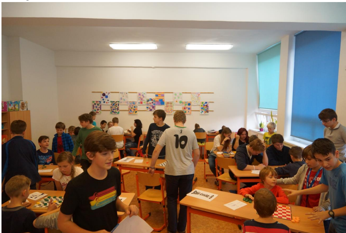
Turnaj v dámě si organizovali žáci Gutovské rady sami