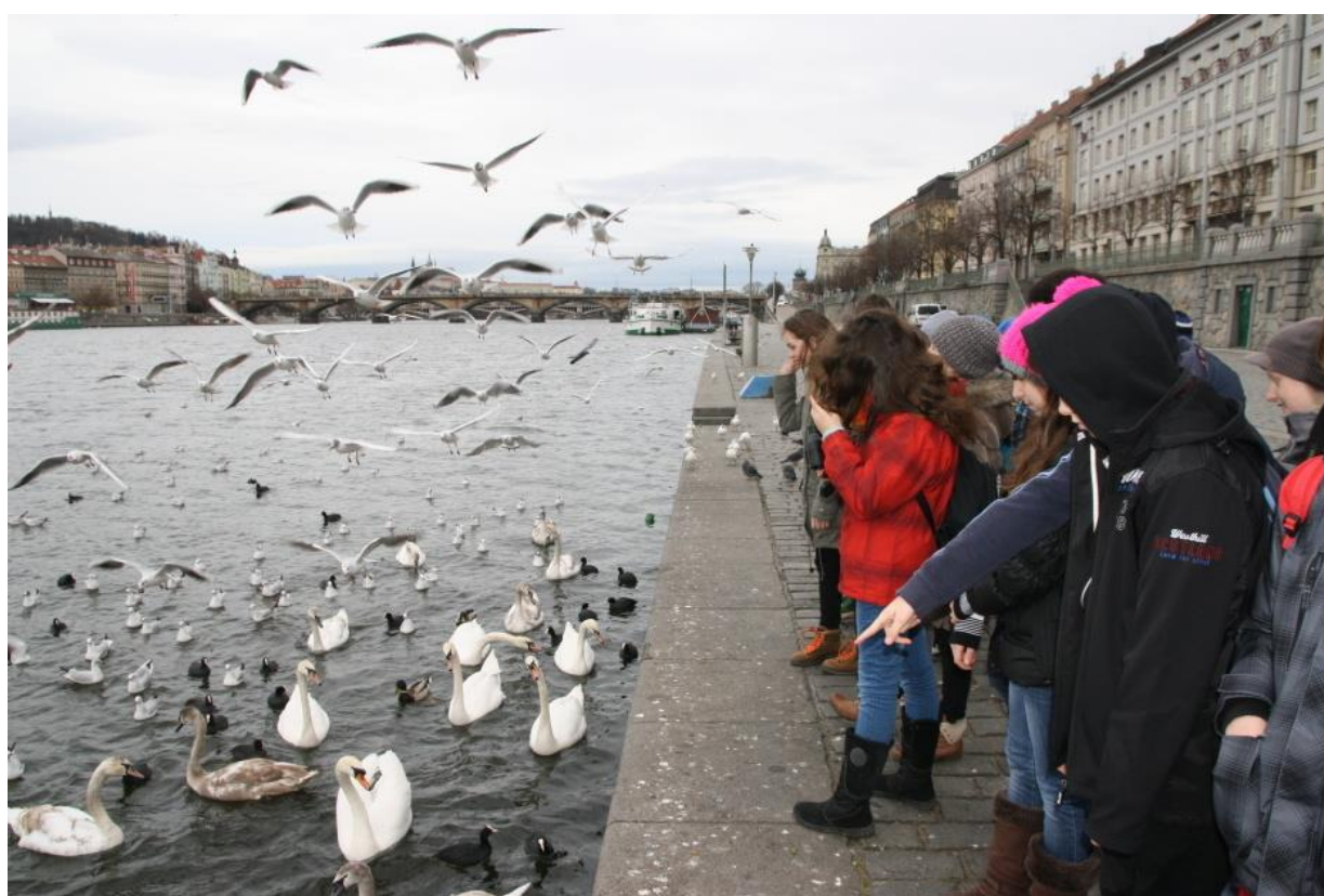
Environmentální vycházka – ptáci na Vltavě – s odborným výkladem