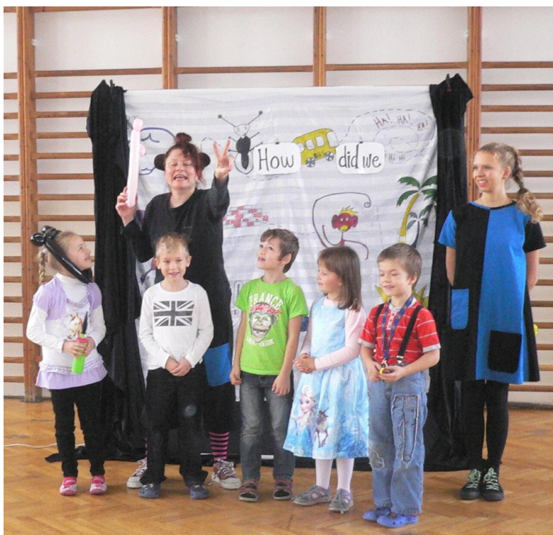
Pohádka v anglickém jazyce - herečka je rodilou mluvčí.