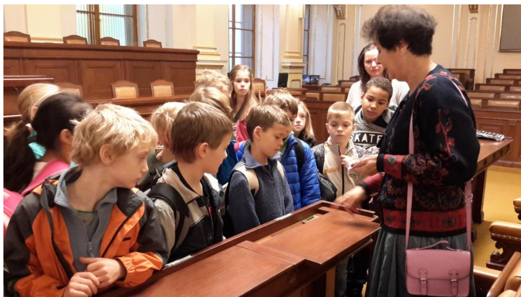
Hlasuje se - tentokrát v poslanecké sněmovně parlamentu ČR