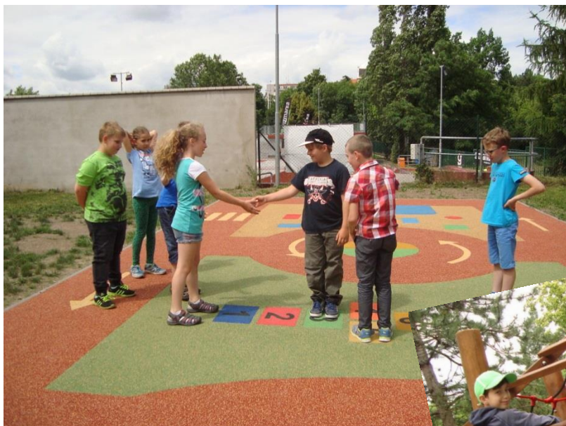
Nové hřiště pro školní družinu

Součástí přijímání/přestupu žáků z jiné školy je též přijímací řízení do skupin s rozšířenou výukou matematiky ( RVM ). Podrobněji na str. 18