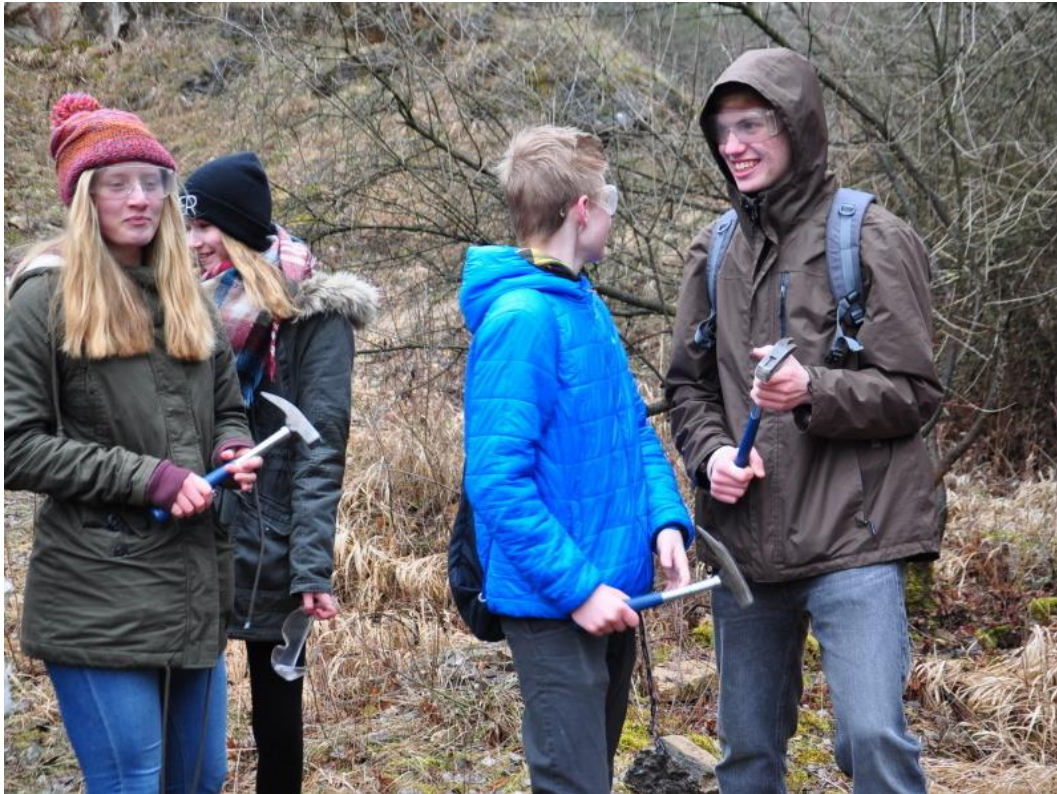
Ochranné brýle a geologická kladívka – jsme na geologické exkurzi v Prokopském údolí