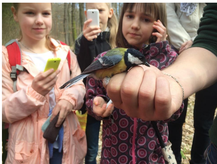
Environmentální exkurze – kroužkování ptáků