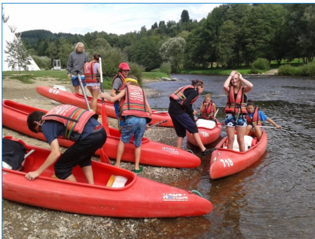
VODÁCKÝ KURZ - Vltava pod Vyším Brodem- žáci 9. tříd