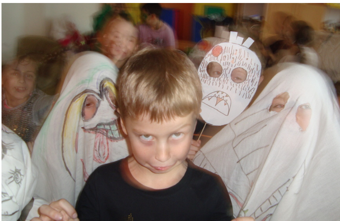
Den duchů ve školní družině (vytvořeno v rozmazávacím programu Dracula-fotoshop)