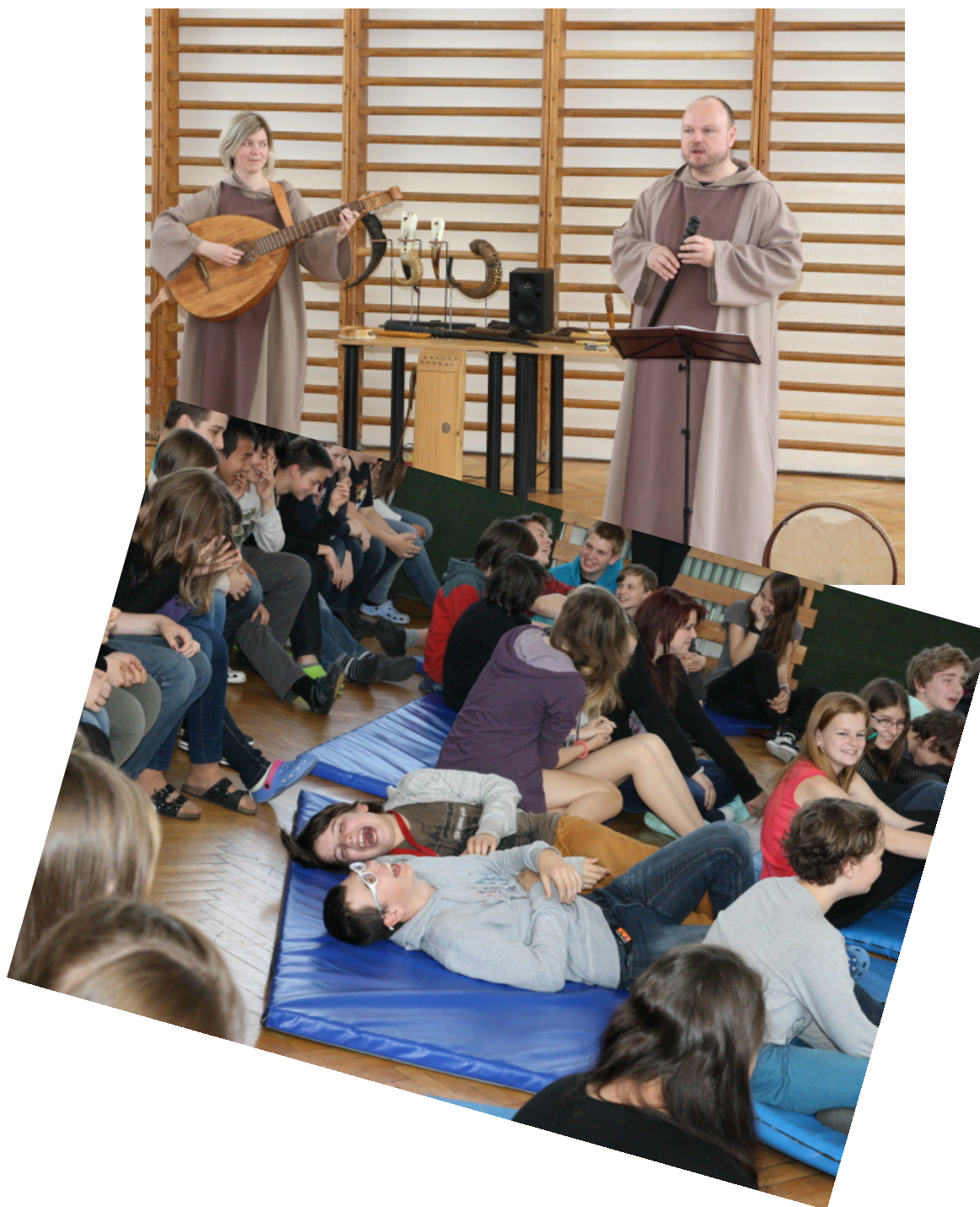
VYSTOUPENÍ SKUPINY SOLI DEO - UKÁZKY STŘEDOVĚKÉ HUDBY (který zvuk nástroje "šófar" asi nejvíce rozesmál žáky 8. tříd?)