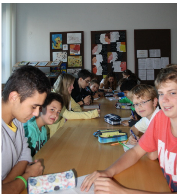
ŽÁKOVSKÝ PARLAMENT jednání Gutovské rady.