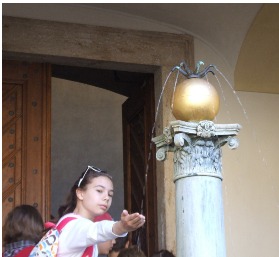
PRAŽSKÝ HRAD - PLEČNIKOVA KAŠNA (žáci 5. tříd vstupují do Starého paláce)