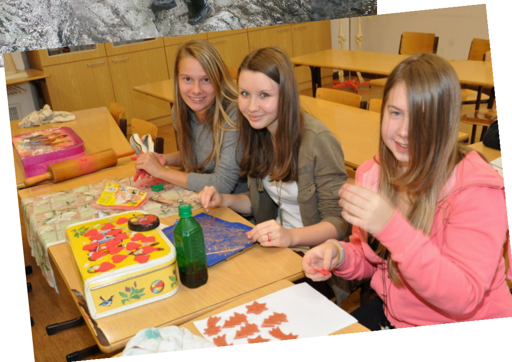
TURISTICKO ADAPTAČNÍ KURS - ŽÁCI 6. TŘÍD VE SLEPIČÍCH HORÁCH ŽÁKYNĚ 9. TŘÍD PŘI VÝROBĚ ZBOŽÍ NA JARMARK