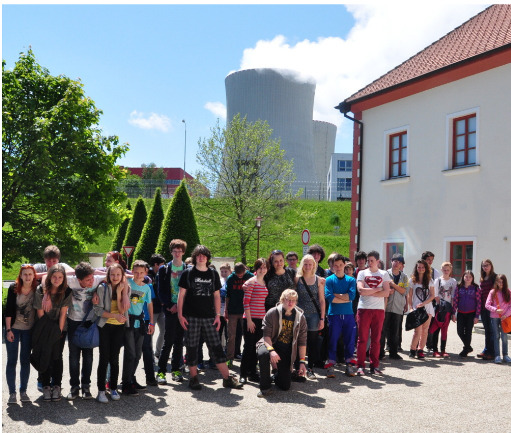
ŽÁCI 2. STUPNĚ NA EXKURZI V JADERNÉ ELEKTRÁRNĚ TEMELÍN

Uvedené části výroční zprávy byly zkompletovány 8. září 2014